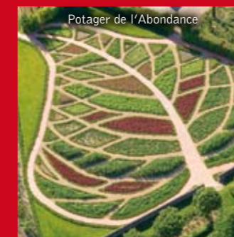
Potager de l'Abondance