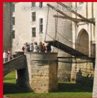
Le Pont-levis de Langeais