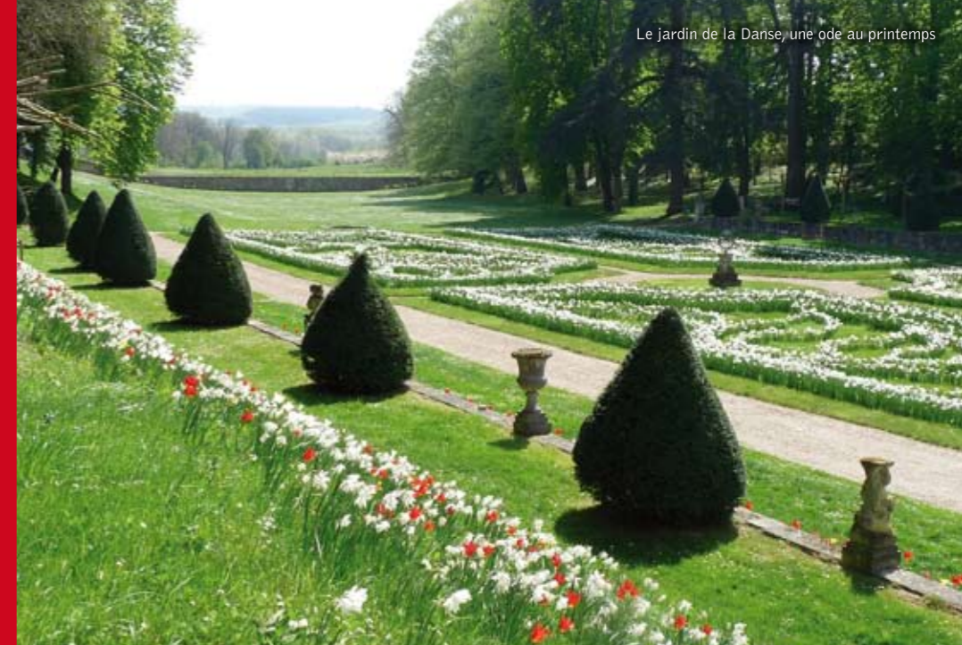
Le jardin de la Danse, une ode au printemps