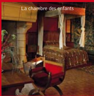
La chambre des enfants