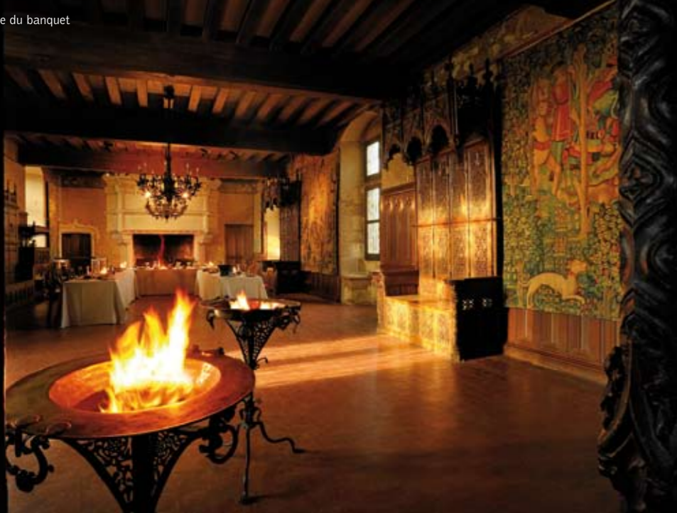
La salle du banquet