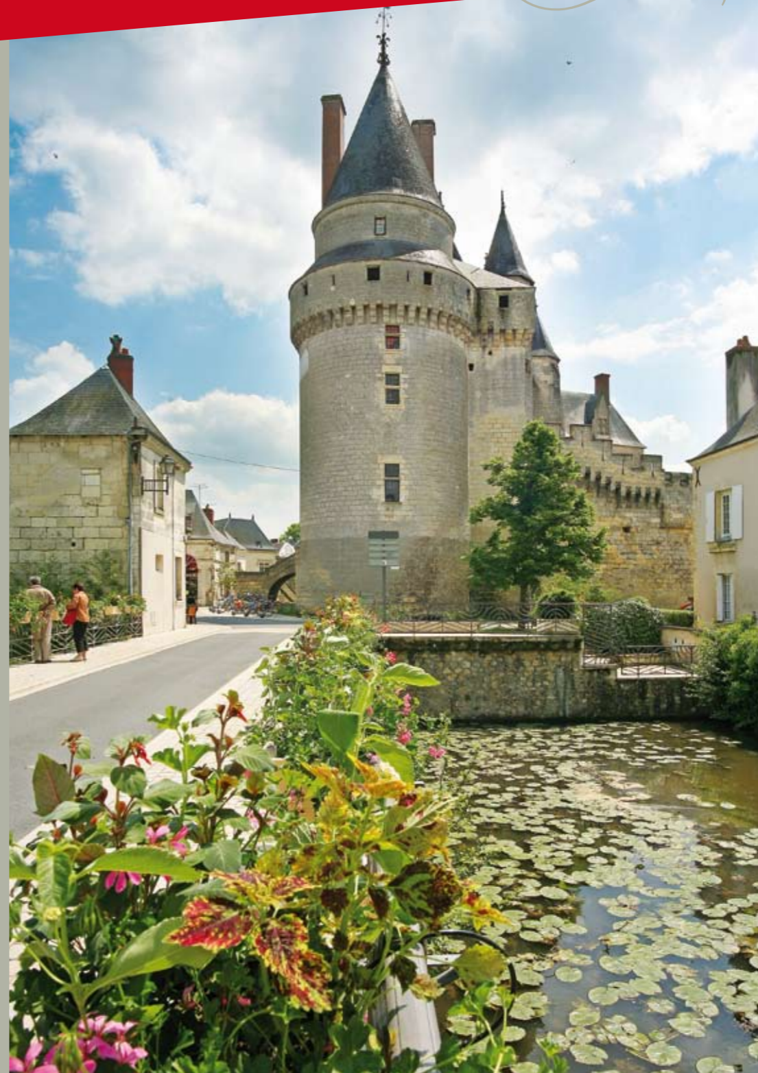
Château de Langeais

www.cv.fr • Crédits photos : J.M. Laugery, J. B. Rabouan, Pixalle, Comdiart, Stevens Frémont, Jean-Pierre Klein.