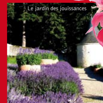
Le jardin des jouissances