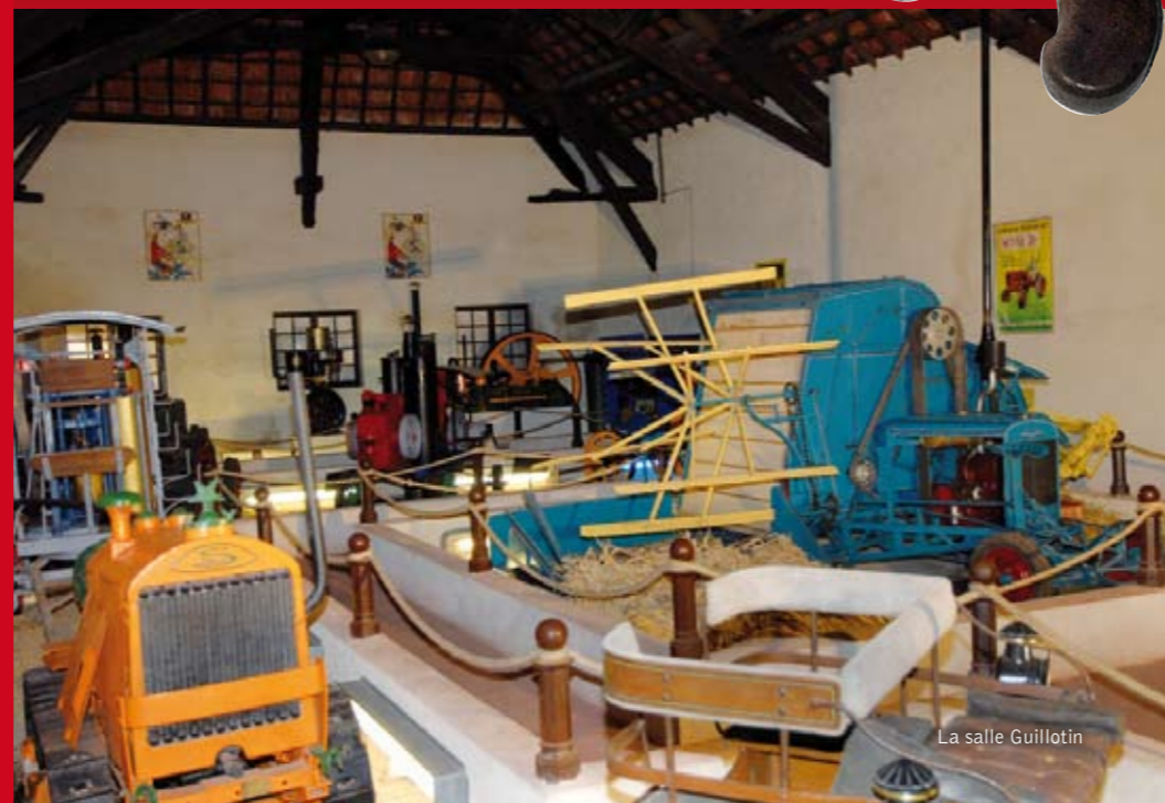
La salle Guillotin